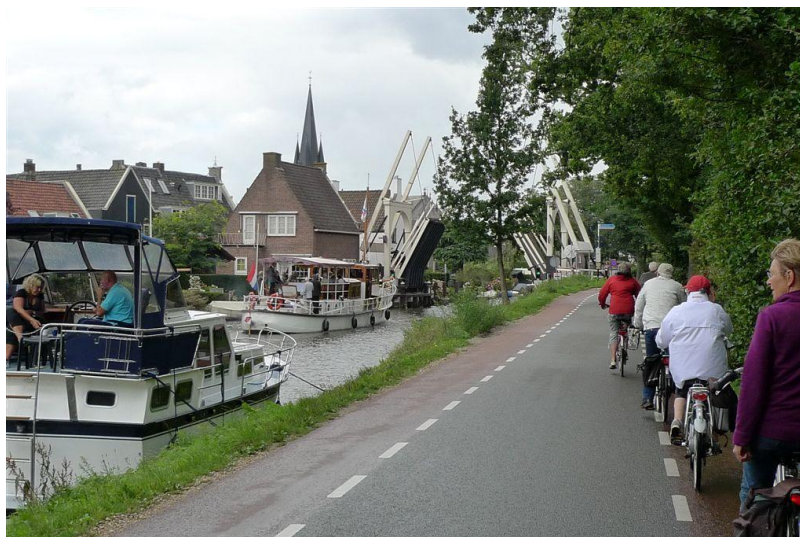
Langs de Vecht in 2010

Graag eerst een e-mail naar penningmeester@hpnlseior.nl voor eerste aanmelding aantal personen/huurfietsen. Na positief bericht van de penningmeester kan het bedrag worden overgemaakt op bankrekening 1189.63.287 t.n.v. Penningmeester HP NL SENIOR te Ter Aar.