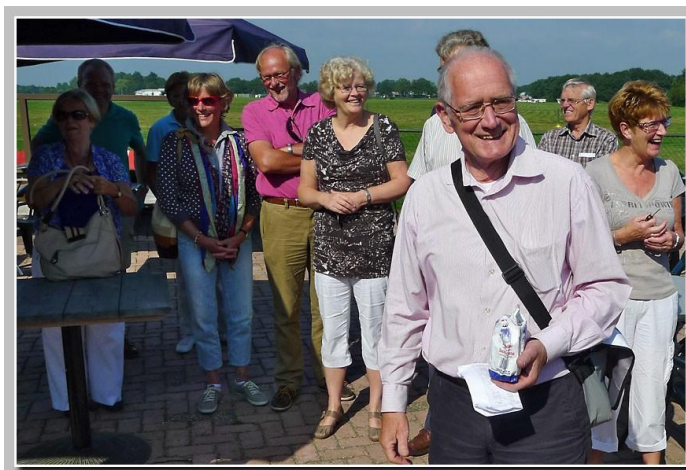
Het potje honing

Indien het bestuur ook in 2012 weer akkoord gaat met een fietstocht, zijn gidsen van Fietsgilde 't Gooi bereid de organisatie op zich te nemen. Maar een activiteit elders in het land behoort vanzelfsprekend ook tot de mogelijkheden.