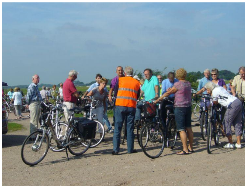
Vliegveld Hilversum 2011

Graag eerst een e-mail naar penningmeester@hpnlsenior.nl voor eerste aanmelding met daarbij het aantal personen/huurfietsen. Na positief bericht van de penningmeester kan het bedrag worden overgemaakt op bankrekening 1189.63.287 t.n.v. Penningmeester HP NL SENIOR te Ter Aar.