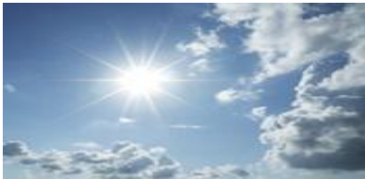
workshop wolken herkennen

Altijd al benieuwd geweest hoe het weerbericht van o.a. RTL4 tot stand komt?